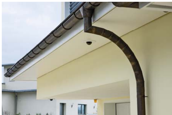
Garageneinfahrt mit Videokameras.