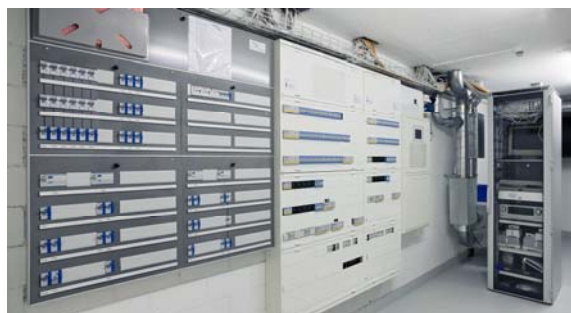
Technikraum mit Steuertableau, Alarmanlage und Videoserver

Das Herz der gesamten Anlage, der Videoserver und das Steuertableau, befinden sich im Keller des Hauses. Hier ist genügend Platz und auch die konstante Temperatur für die Betreibung des Systems ist gewährleistet.