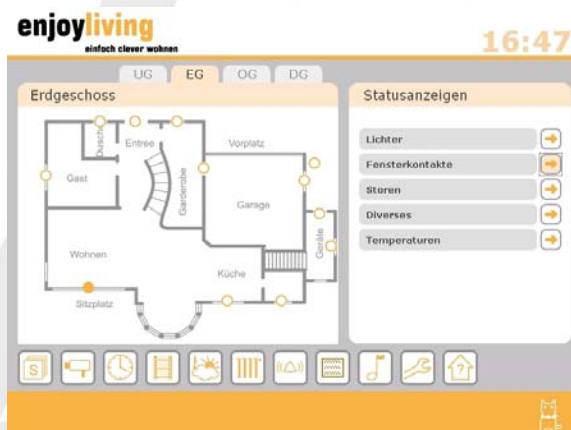
Anzeige der Fensterkontakte auf der Visualisierung.

Sämtliche Fenster des Hauses sind im Home Automationssystem ebenso perfekt integriert und mit der Alarmanlage vernetzt. Wird auf dem Touchscreen der Fenstermode gewählt, kann vor Verlassen des Hauses, kontrolliert werden, ob ein Fenster offen ist und dies spart Zeit.