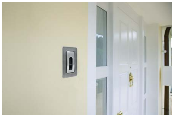
Türöffnung mittels Fingerabdruck.

Schon beim Betreten des Grundstückes lässt sich erahnen, welch ausgeklügeltes Alarmsystem im Haus installiert ist. Neben den Überwachungskameras und der Bewegungsmelder fallen vor allem die Türöffner ins Auge. Das Garagentor sowie die Eingangstüre lassen sich per Fingerabdruck öffnen. Der lästige Schlüsselbund gehört damit in diesem modernen Haus der Vergangenheit an. Mit den Fingern der einzelnen Familienmitglieder lassen sich sämtliche Aussentüren einfach und bequem öffnen. Falls ein Schlüssel verloren geht oder die Tür zufällt, muss kein Schlüsseldienst gerufen werden.