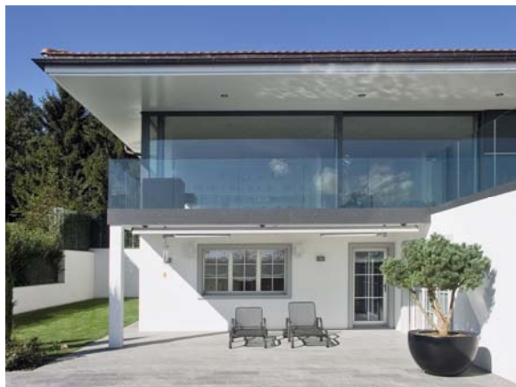
Der imposante Neubau „Grossrüti“.

Der imposante Neubau „Grossrüti“ liegt in traumhaft erhöhter Lage im Aargau – in der weiteren Agglomeration der pulsierenden Stadt Zürich. Das Projekt zeigt, dass sich unterschiedliche Anforderungen, wie technische Perfektion, Komfort in der Bedienung, Befriedigung von Sicherheitsbedürfnissen und verspieltes Entertainment in einem Home Automationsprojekt umsetzen lassen. Dies bei gleichzeitig ansprechender Ästhetik.