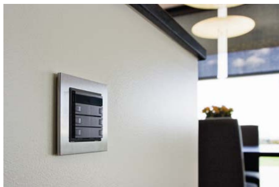
Bedienpanel und Funktionstaster zur Steuerung der Anwendungen im ganzen Haus.

Neben Licht-, Jalousien- und Lüftungssteuerung wurde auch eine Alarmanlage mit Türüberwachung und Kameras in das Gesamtsystem integriert.