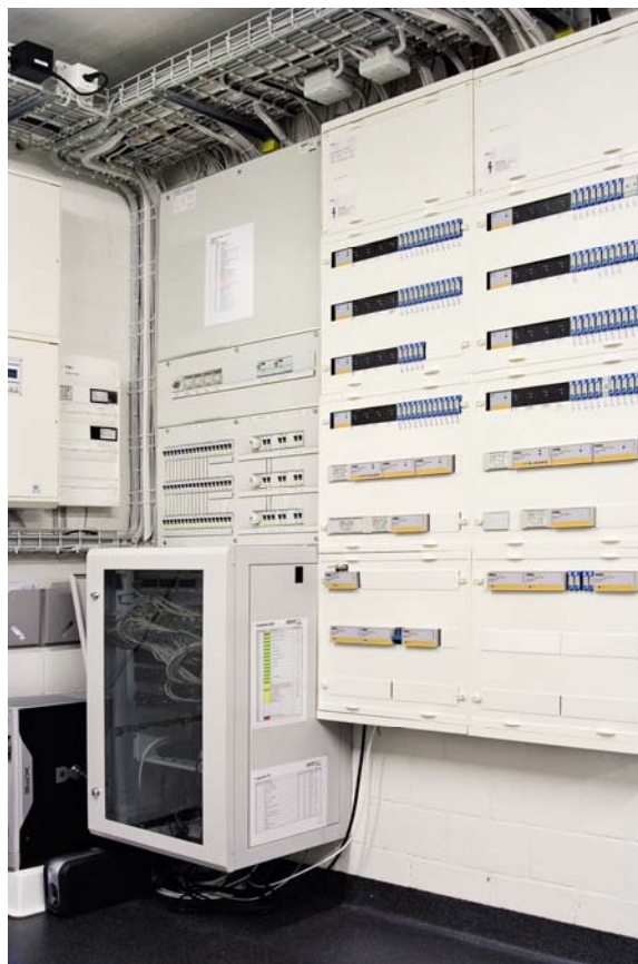
Herzstück des Home Automationssystems: Steuertableau, Sicherungsverteilung, 19"-Rack, Alarmanlage und Media Center.

Gerade bei der Übermittlung von Audio- und Videodaten stossen herkömmliche Bussysteme an ihre Grenzen, erfordern doch die grossen Datenpakete eine hohe Übertragungsleistung. Für das leistungsstarke TCP/IP-Netzwerk von Enjoyliving bereitet dies jedoch keine Probleme.